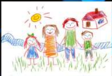
Die Familie - La familia