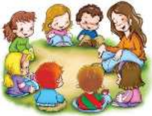
Círculo de la mañana