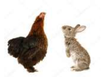
Cuidado de animales