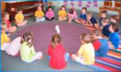
Morgenkreis - Circulo de la mañana