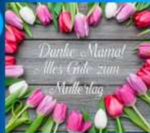
Muttertag - Día de la madre