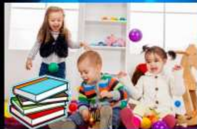
Spielzeugtag - Día de juguetes