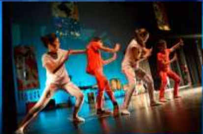
Szenische Künste - Artes escénicas