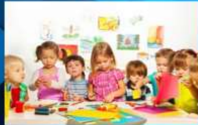
Basteln - Manualidades