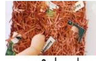
Buscar la familia