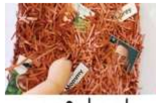
die Familie suchen