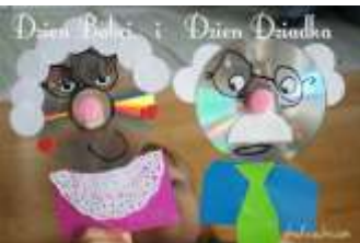
Oma und Opa