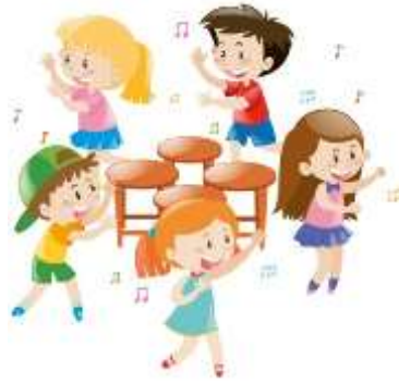
Spiele und Runden