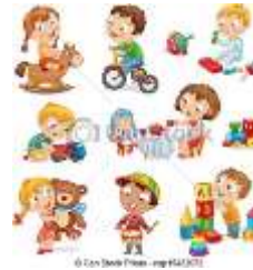
Día del Jugete