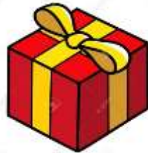
Regalo día de la Madre